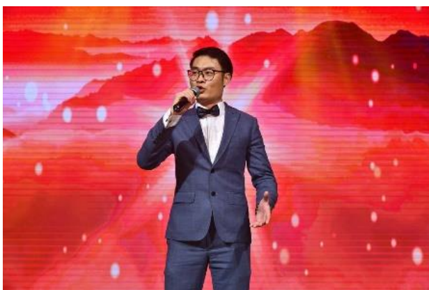
男聲獨唱《不忘初心》《斗牛士之歌》