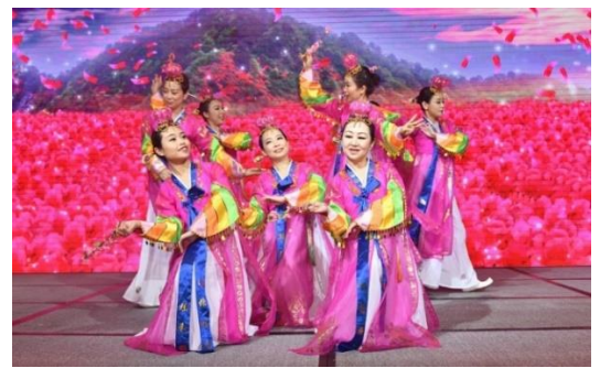
萬紫千紅舞蹈團表演