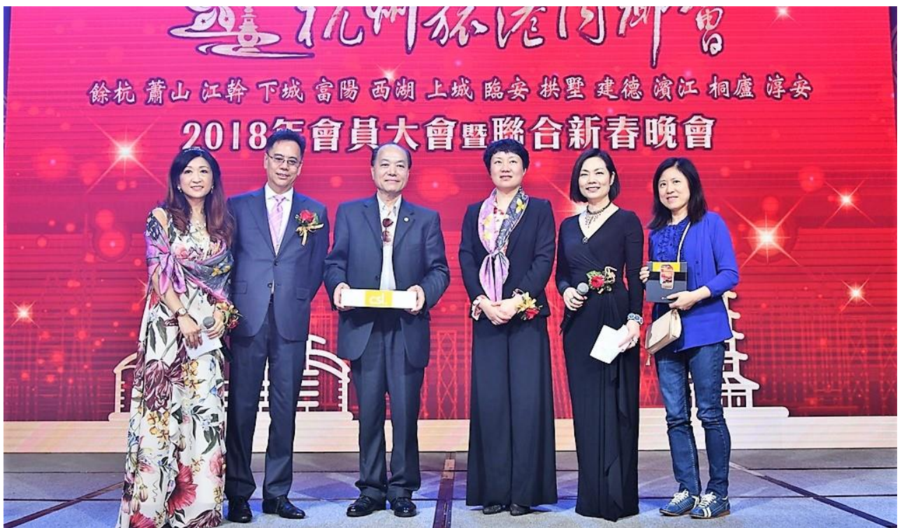
抽到了 CSL 贊助的 mate10 手機 (中) 和 蘋果手錶獎 (右)