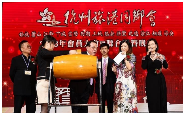
名譽會長邊亦平正在抽獎